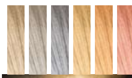
KOLORY PODSTAWOWE 6 Kolorów podstawowych, które można mieszać z baza tonującą lub rozjaśniającą, aby wykreować neutralne, zimne i ciepłe odcienie blond.